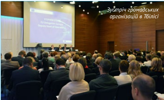
Зустріч громадських організацій в Тбілісі