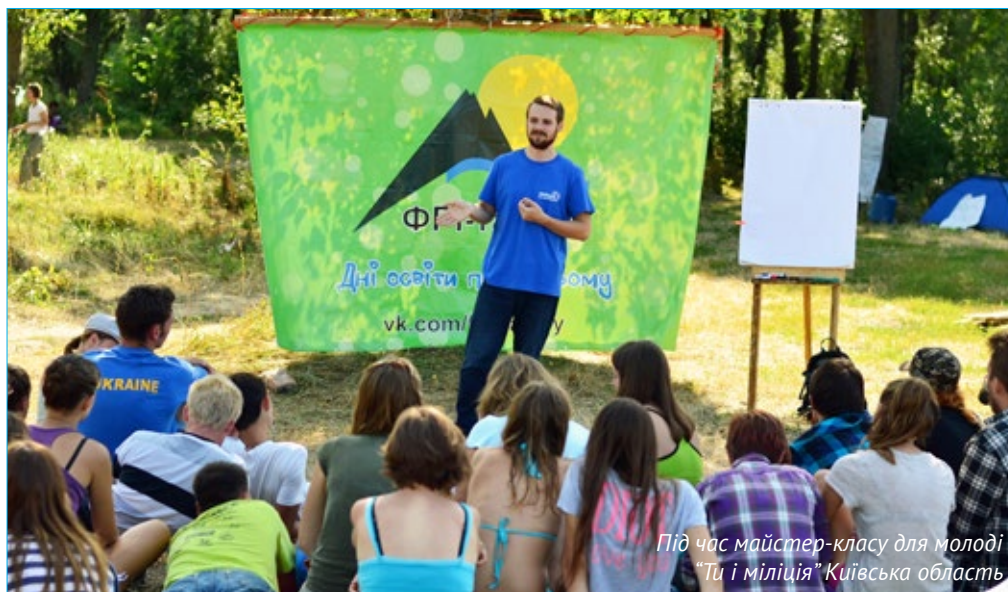
Під час майстер-класу для молоді «Ти і міліція» Київська область