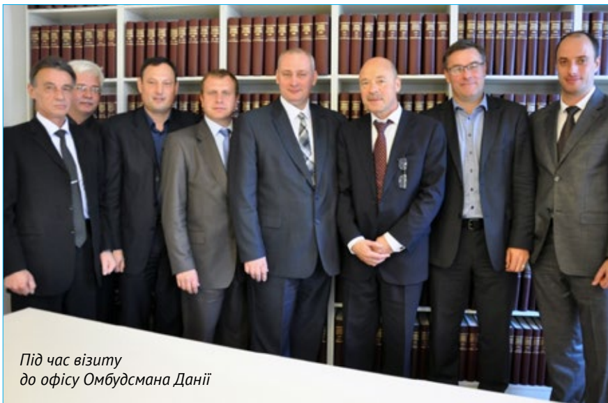
Під час візиту до офісу Омбудсмана Данії

Міжнародна діяльність Асоціації: приклад Молдови