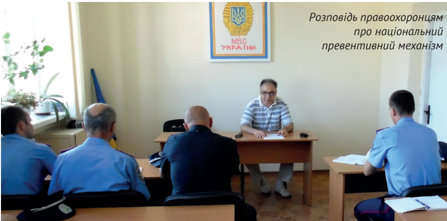
Розповідь правоохоронцям про національний превентивний механізм