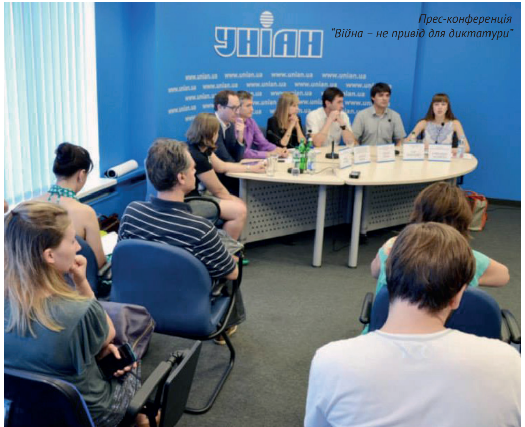
Прес-конференція «Війна – не привід для диктатури»