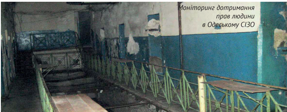
Моніторинг дотримання прав людини в Одеському СІЗО