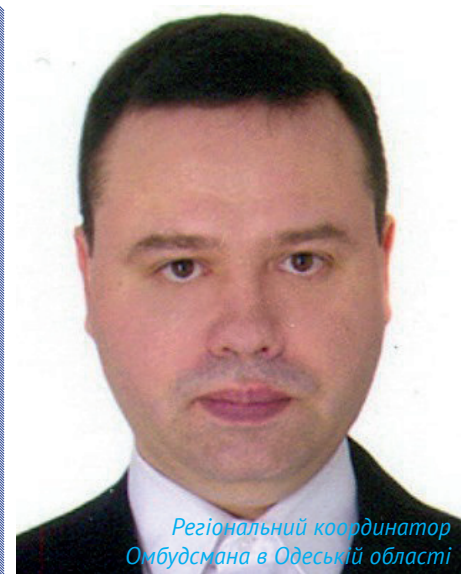
Регіональний координатор Омбудсмана в Одеській області