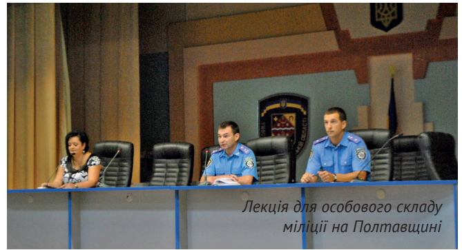
Лекція для особового складу міліції на Полтавщині

Представник Омбудсмана перевірила дотримання прав військовозобов'язаних