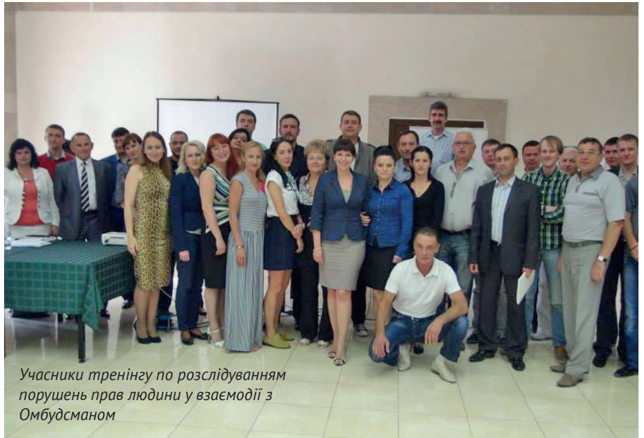
Учасники тренінгу по розслідуванням порушень прав людини у взаємодії з Омбудсманом