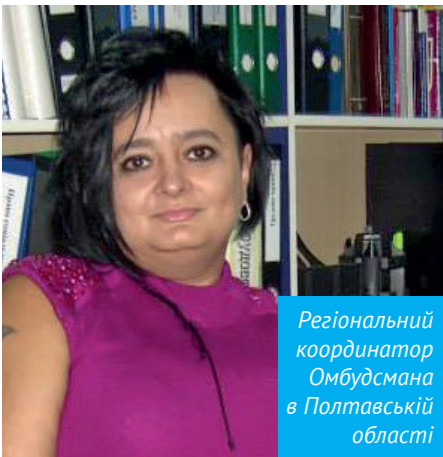
Регіональний координатор Омбудсмана в Полтавській області